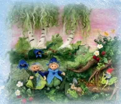
Bild aus Schafwolle